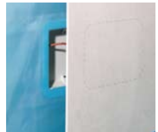
Mit innenliegendem Wechsel. Montage avant pare-vapeur.