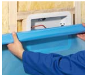
Mit innenliegendem Wechsel. Montage avant pare-vapeur.