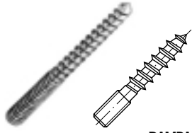
RAMPA Dowel Screws type N